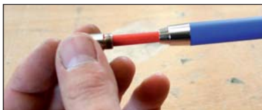
Einfaches Anspitzen durch den in der Druckkappe integrierten Spitzer