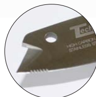
Zweischneidige Klinge inkl. Sägezähne