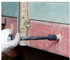
...und verrostete Schrauben