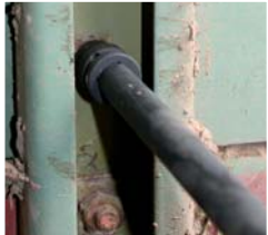
Für schlecht erreichbare,...

19-tlg, bestehend aus den Größen 10, 11, 12, 13, 14, 15, 16, 17, 19, 21, 24 mm, Verlängerungen 75,125, 250 mm und Knebelgelenk 3/8", Sicherungsringe \varnothing 19, 24mm, Sicherungsstifte \varnothing 3x20, \varnothing 3x25mm.