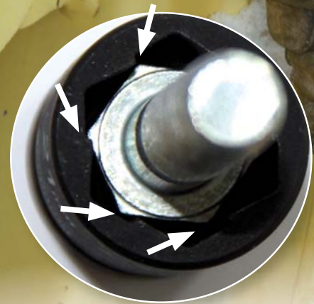
Kraft-Kralle-Spezial-Profil für besonders starken Griff aus speziell gehärteter Stahl