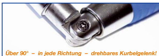
Über 90° – in jede Richtung – drehbares Kurbelgelenk!