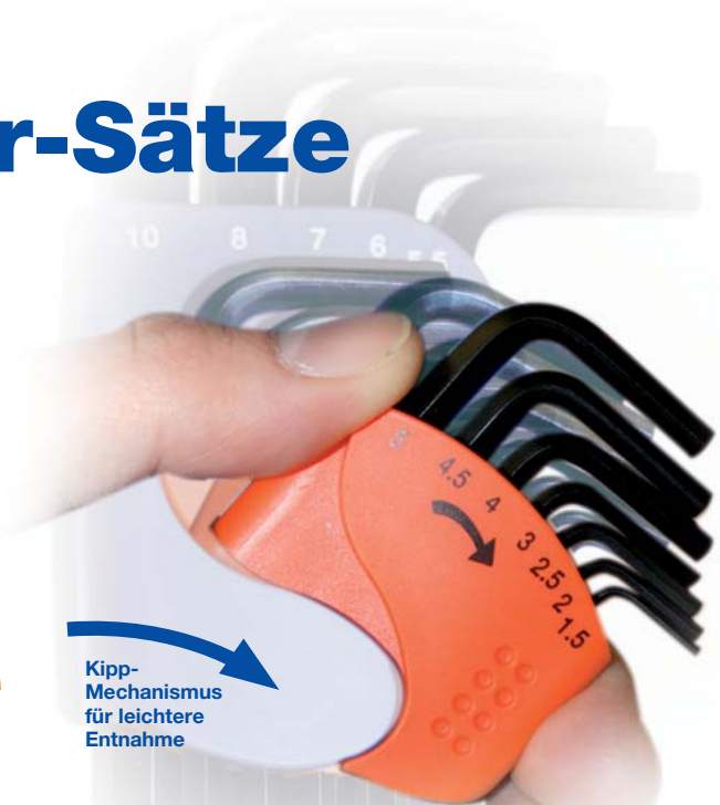
Kipp-Mechanismus für leichtere Entnahme