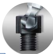
abgewinkeltes Schrauben bis zu 25° möglich

TX8, TX10, TX15, TX20, TX25, TX27, TX30, TX40, TX50