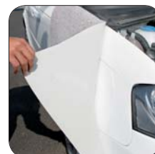
Rückstandsloses Ablösen garantiert