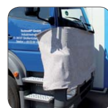
... optimal für den Einsatz an größeren Fahrzeugen