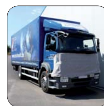
Auch als Meterware erhältlich ...