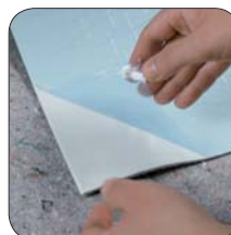
Schutzfolie entfernen ...