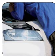
ACHTUNG: Scheinwerfer nicht bedecken