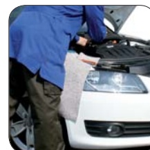
... auf die zu schützende Stelle aufbringen