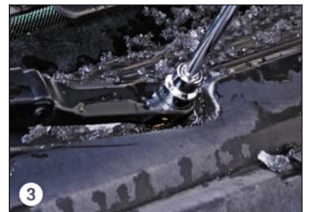
3 Mutter abschrauben