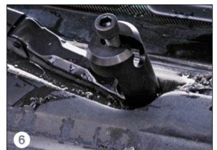
6 Geraden Sitz prüfen