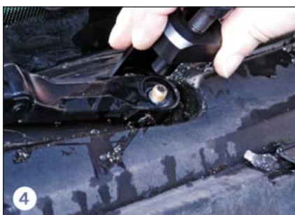
4 Abzieher aufsetzen