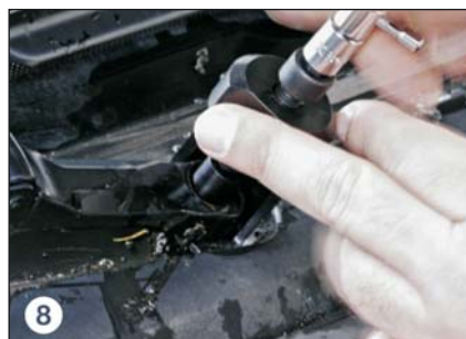
8 Vorsichtig abziehen