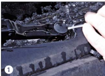
1 Kappe abnehmen

Der 6-teilige Scheibenwischer-Abziehersatz passend für alle VW, Audi, Seat, Skoda bis Baujahr '08 und andere. Nachfolgend sind die einzelnen Schritte einer fachgerechten Demontage aufgeführt: