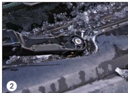
2 Mutter wird sichtbar