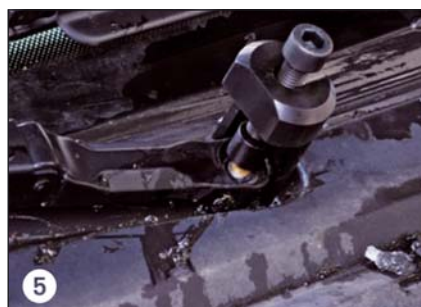
5 Abzieher ausrichten