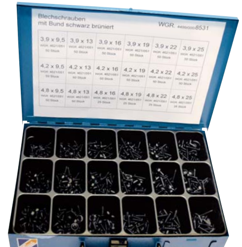
Art.-Nr. Bezeichnung N 630 011 Blechschauben mit Linsenkopf und Bund