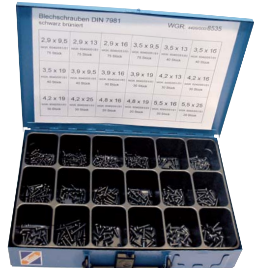
Art.-Nr. Bezeichnung N 630 015 Blechschräuben DIN 7981