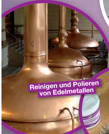
Reinigen und Polieren von Edelmetallen