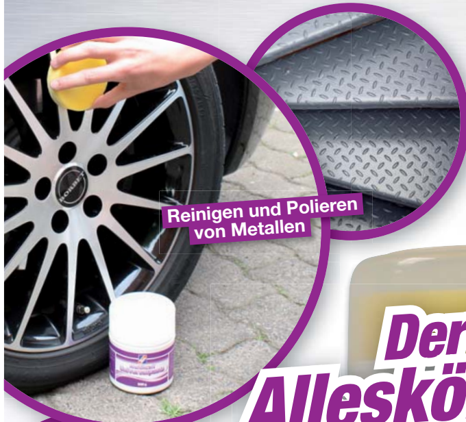
Reinigen und Polieren von Metallen