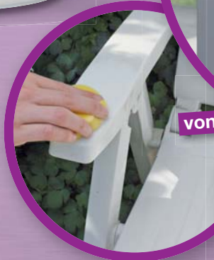
Reinigen und Polieren von Glas und Kunststoff