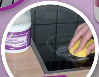
Reinigen und Polieren von Ceranfeldern