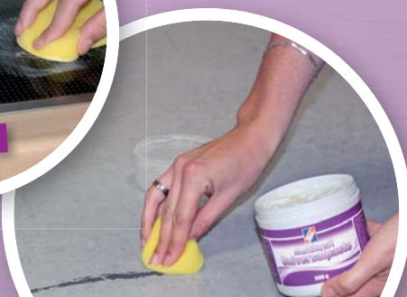
Entfernen von Absatzstrichen von Fußböden