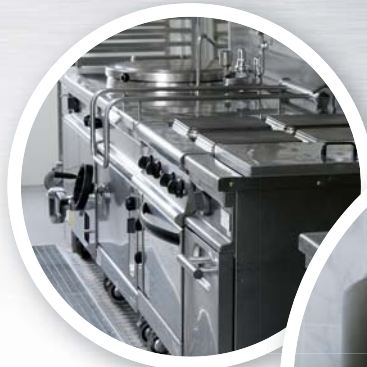
Reinigen und Polieren von Edelstahl