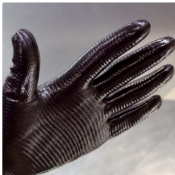
• Reifenartiges Profil ermöglicht eine hohe Griffsicherheit.