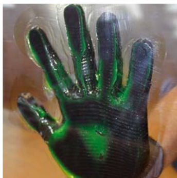
• Verdrängung wässriger Substanzen