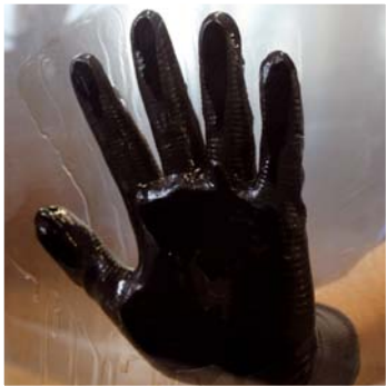
• Verdrängung öliger Filme