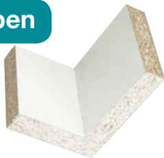
Fertige Verbindungen blitzschnell!